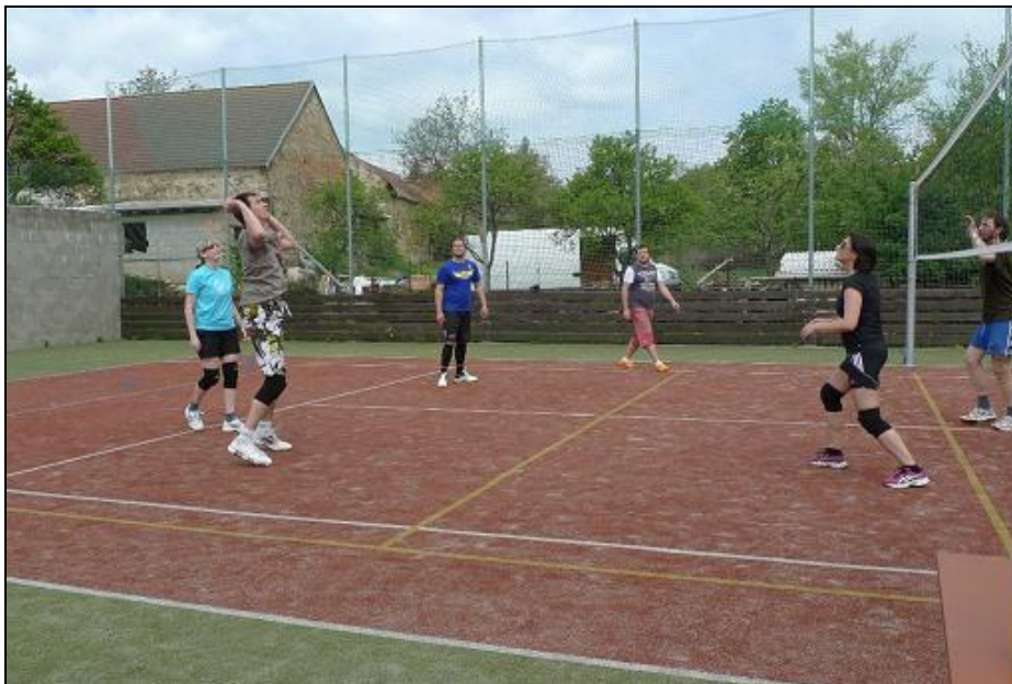
Obrázek 4: Volejbalový turnaj ve Valči

V improvizované sestavě jsme se zúčastnili tradičního volejbalového turnaje ve Valči. Bohužel výsledky nebyly jaké jsme si přáli, ale i tak jsme si to užili.