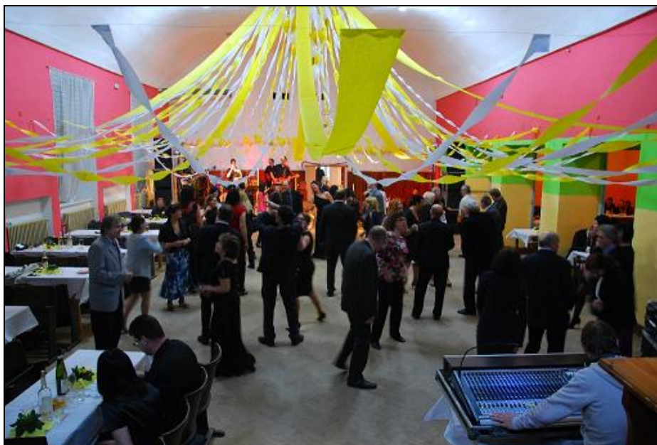
Obrázek 3: Společenský ples s Mohelenskou chasou

Jako loňský rok tak i letos jsme ve spolupráci s Mohelenskou chasou uspořádali společenský ples. K tanci a poslechu hrála populární hudební skupina Dreams a přestože účast nebyla nijak vysoká, večer se povedl.