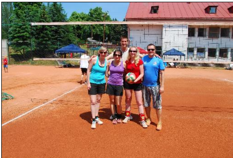
Obrázek 5: Volejbalový turnaj Brtnice

S dívkami v přesile jsme se zúčastnili tradičního jarního volejbalového turnaje pořádaného TJ Sokol Brtnice.