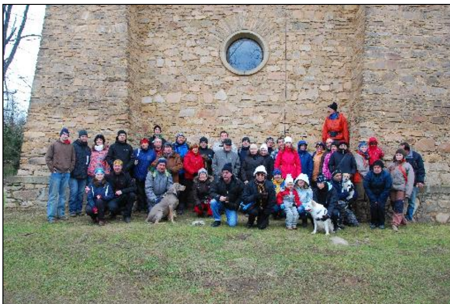
Obrázek 2: Novoroční výstup na Babylon

O týden později jsme uspořádali vlastní novoroční výstup na rozhlednu Babylon. 4. ročníku se zúčastnilo cca 40 osob.