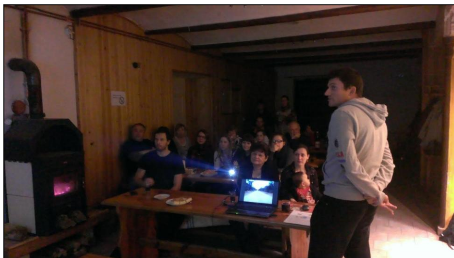
Obrázek 8: Cestovatelský večer

11. prosince jsme zopakovali úspěšnou loňskou akci - Cestovatelský večer. Několik cestovatelských nadšenců opět promítalo pro účastníky akce fotky ze svých exotických cest.