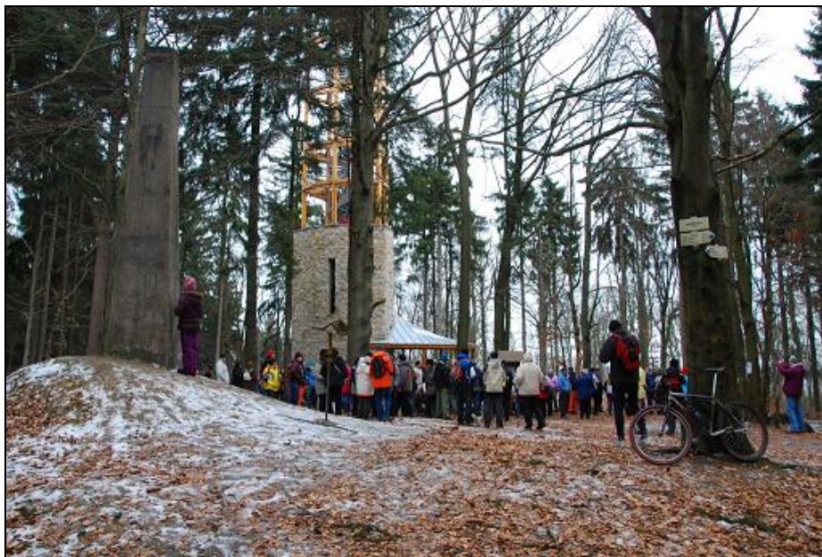
Obrázek 1: Novoroční výstup na Mařenku

Rok 2015 jsme zahájili účastí na akci pořádané Župou plk. Švece - tradičního novoročního výstupu na nejvyšší vrchol regionu (45. ročník), Mařenka.