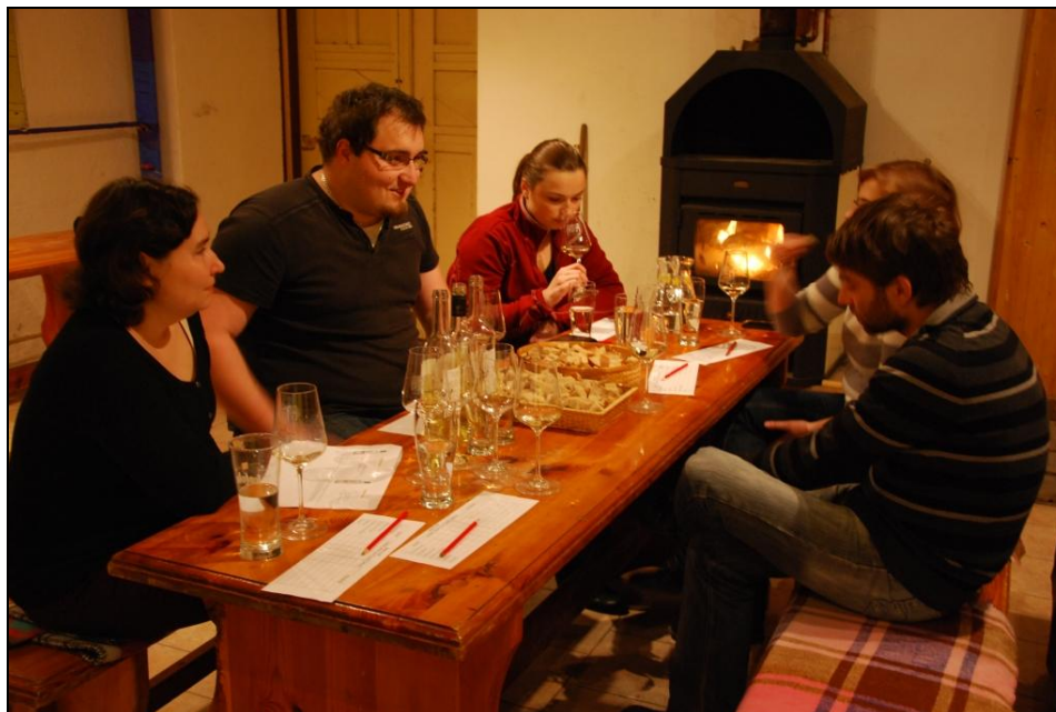
Obrázek 9: Degustace vín - Francie

Vyzkoušeli jsme zorganizovat i degustaci vín - vinařství Vignerons Catalans, Francie.