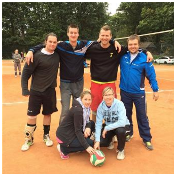
Obrázek 6: Volejbalový turnaj Brtnice

V roce 2015 jsme si nenechali ujít podzimní burčákový turnaj v Brtnici, umístili jsme se na 8. místě z celkového počtu 15 nahlášených týmů.